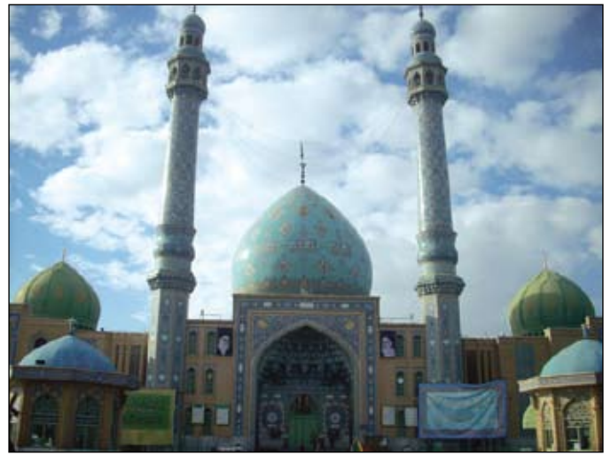
JAMKARAN MOSKEIJA, QOM.

Imam Rezalla tutustuimme myös museoon, joka sijaitsi moskeijan yhteydessä. Museoon toiseen kerrokseen oli koottu vanhoja käsinkirjoitettuja Koraaneja, yhden uskotaan olevan shiialaisten ensimmäisen imaamin Imam Alin