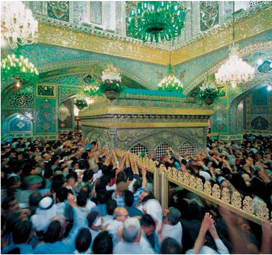
IMAM REZAN (RH) MOSKEJA, MASHHAD.

kojen rajoihin [eritoten Medinan (joista voisi päätellä, että Medinan perustuslaki oli osana tämän kirjan sisällöstä)], turvapaikan myöntämisen olosuhde vaatimukset jne. 5 Jotkut sunnilähteistä mainitsevat sen olevan pieni pergamentti, jota Imam Ali (rh) säilytti miekansa tupessa 6 , mutta silkka tiedon määrä, mitä kirjan sanotaan sisältäneen vihjaa, että on sattunut sekaannus kahden asiakirjan välillä. Todellinen Kitabu 'Ali on paljon suurempi teos, josta Imam Ali (rh) on vain kertonut osia riippuen kysyjän tiedustelusta. Totisesti yksi Imam Baqirin (rh) seuraajista, Zaraqah, vastaanotti lukemista varten perimälakiin liittyvän kääron Kitabu 'Alista ja kuvaili tämän olevan "... kamelinjalan paksuinen..." ja "... tiesin tekstin käsikirjoituksen suuruudesta ja paperin paksuudesta; sen olevan vanha ja menneiden aikojen jäännös..." 7