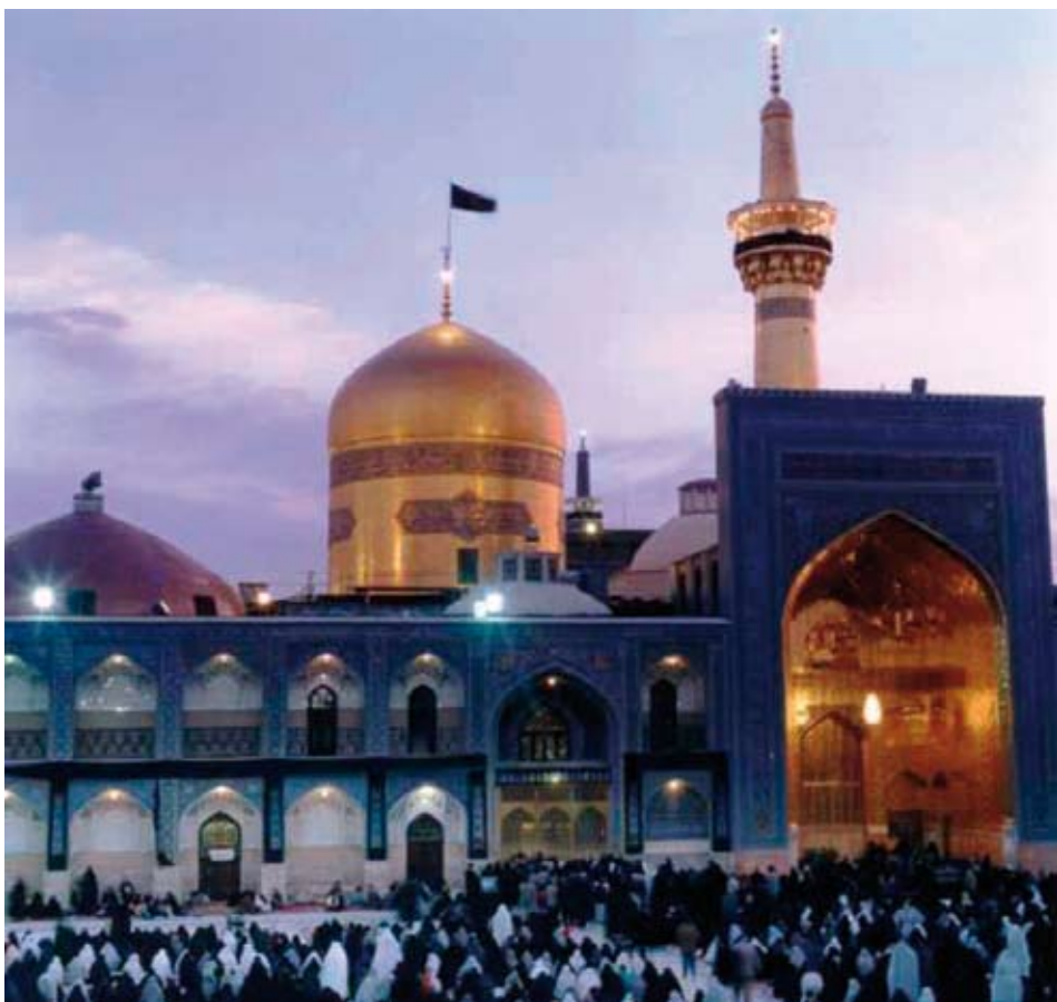
IMAM REZAN (RH) MOSKEJA, MASHHAD IRAN.

Ensimmäinen kokoelma, joihin näitä hadiithej ä oli kerätty oli Abu Ja’far al-Kulaynin kokoelma, al-Kafi . 18 Sen varhaisen kokoamisensa vuoksi hän pääsi käsiksi moniin usuuleihin perustuuviin teoksiin, ja vaikkakin hän eli kolmannella vuosisadalla hijran jälkeen, tämä oli kuitenkin melko aikaista, sillä Pyhien Imaamien