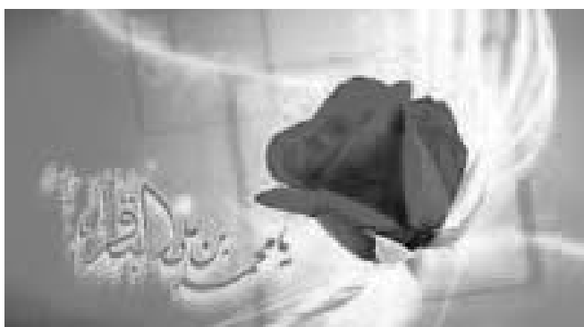
День рождения имама Мухаммада Бакира (а) стр. 4