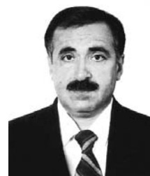
Жизнь, посвя- щенная спорту стр. 12