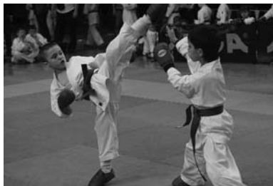
Чемпион России по каратэ-до стр. 12