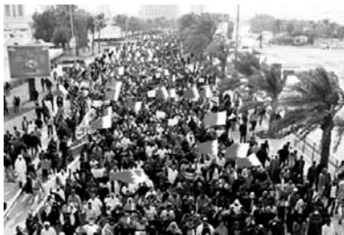
Продолжаются акции протеста против правя- щего режима Бахрейна стр. 10