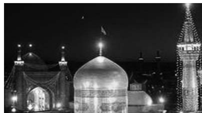
Мавзолей имама Резы (а) в Иране стр. 11

Редакция газеты «Каусар» объявляет новый конкурс на лучшее написание статьи и стихотворения, посвященных Дню рождения имама Махди (а). Победителю будет вручен ценный приз, а отобранное стихотворение или статья будут опубликованы в нашей газете. Просьба отправлять свои работы до 15 июля 2011 г. только по электронному адресу causar-np@mail.ru с точным указанием данных, адреса и номера телефона автора.