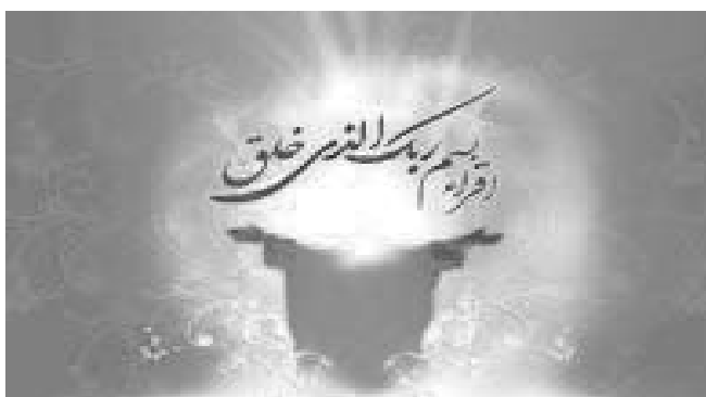
Мабас – начало расцвета человечества стр. 5